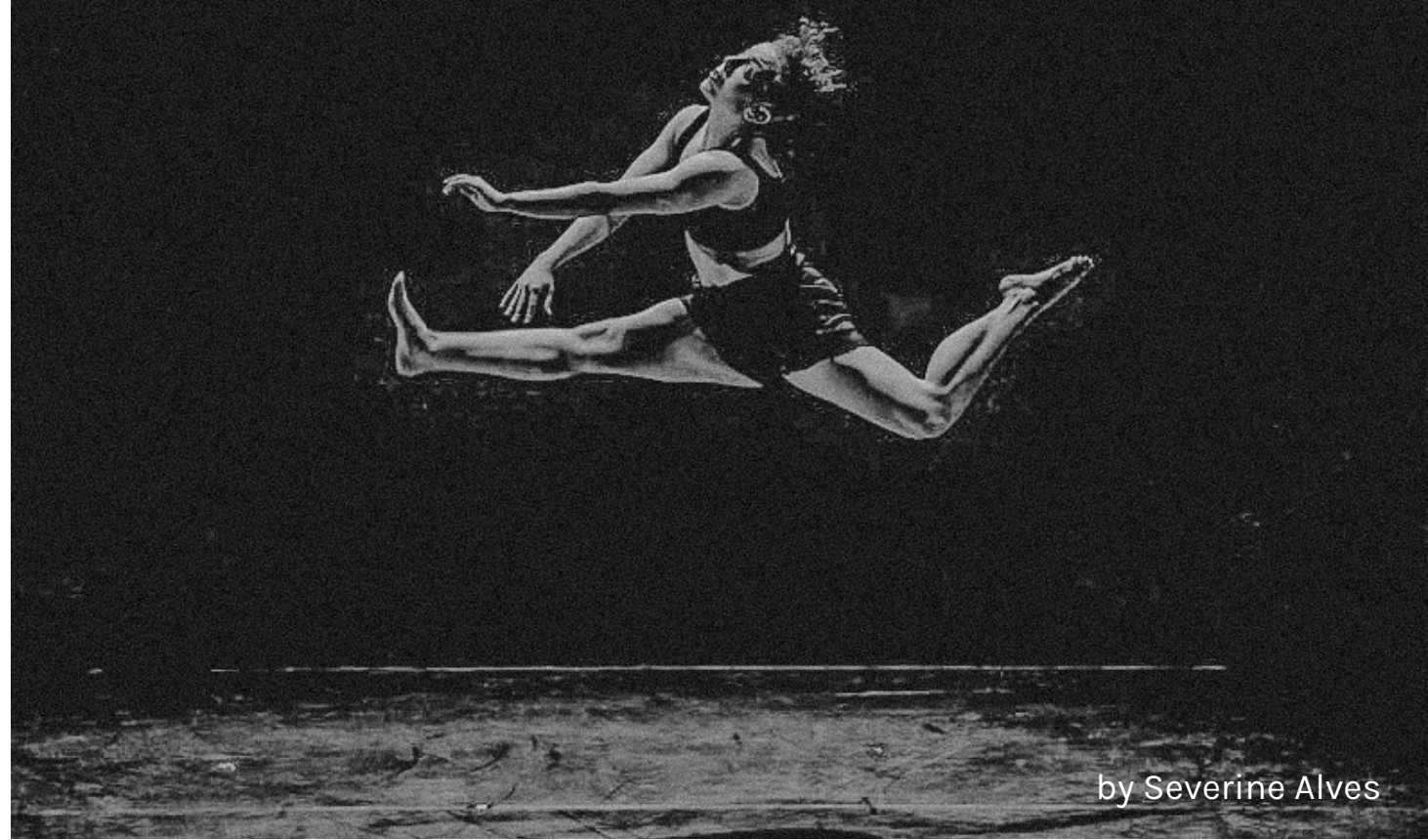
by Severine Alves

"Why do I go back if I know where I come from? Maybe I have a vague hope that something has changed... although the real question is whether I am really stopping living the same thing all the time".