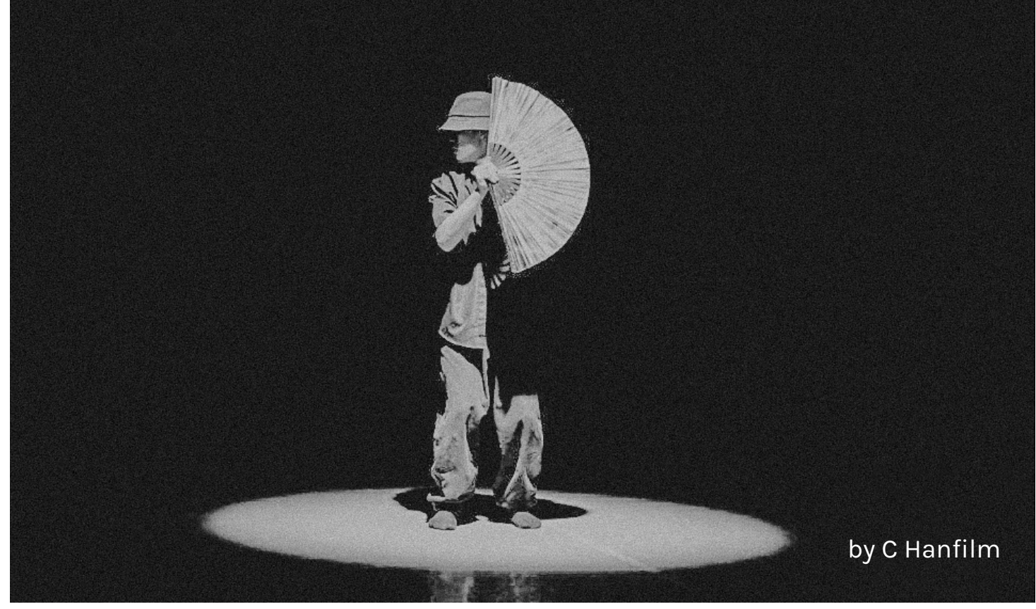
by C Hanfilm

"Time is no longer just an instrument of evaluation, the measure of excellence. It obsesses us, terrifies us, makes us feel guilty and provokes a sense of urgency. There is only one objective: to make the most of this time, always and still, until we obtain satisfaction, and then, hungry for the best, we repeat this scheme indefinitely. We are trapped in a race against the clock, in which we exhaust ourselves by supplying more and more energy. We give body and soul to work. We keep wanting to master time, to control it, but this is only illusory. We have to maintain an idealised self-image, to the point of ignoring our own value and wealth in favour of work".