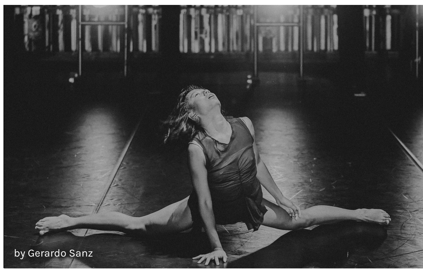
by Gerardo Sanz